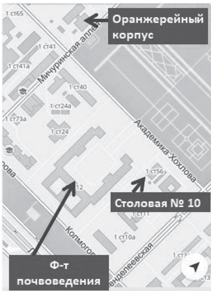
СХЕМА РАСПОЛОЖЕНИЯ ЗДАНИЙ